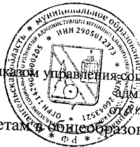
график проведения Олимпиады по предметам в общеобразовательных организациях

Приложение утверждён приказом управления социального развития администрации города