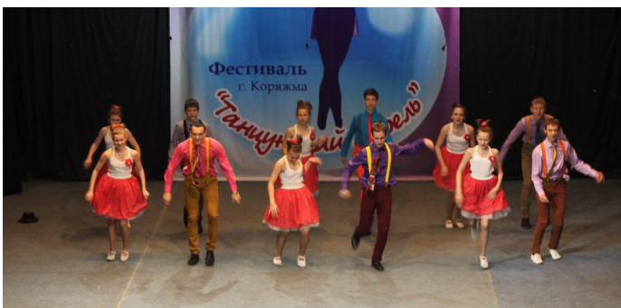
Танцующим апрель стал для 2-х команд из нашей школы: «сборная солянка» - девчонки из 6-х и ребята из разных классов (фото слева), девчата из 9-х и 11-х классов (справа).