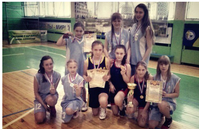
«Весенняя капель». В городских соревнованиях по баскетболу (с участием Вологды, Ухты, Великого Устюга) наши девчонки заняли 2-е место, ребята - 3-е.