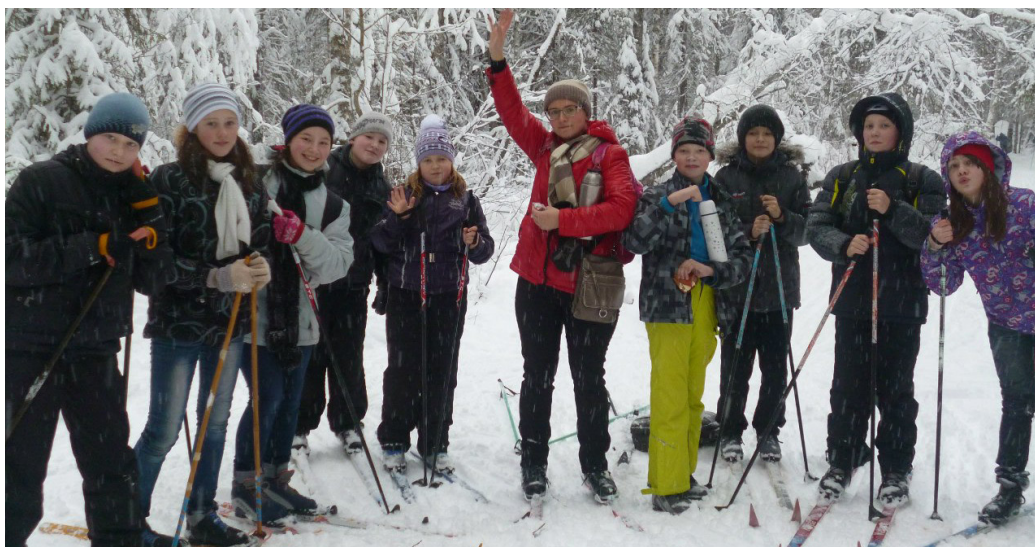
5б класс вместе с классным руководителем к зимней олимпиаде-2014 в Сочи готов!