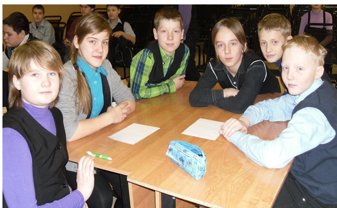
5б класс - победитель «Математической карусели»