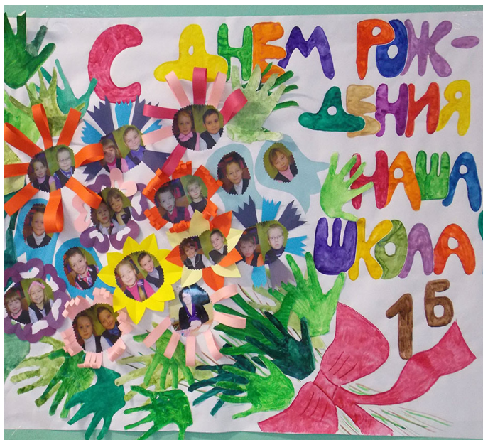
Яркие поздравления от учеников в праздничный день