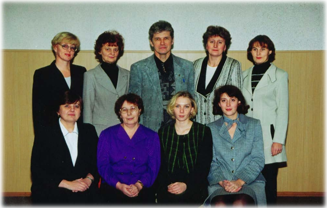
Коллектив школы №5 (13)